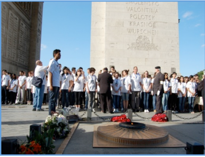
« Sous l' Arc de Triomphe »