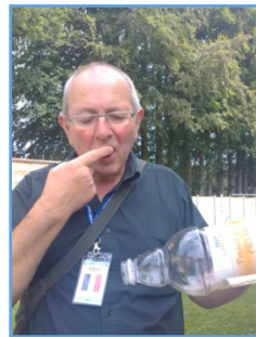
« Les deux chefs à Dieppe Verrazane et Bernard en train de goûter le calvados géliné ! »