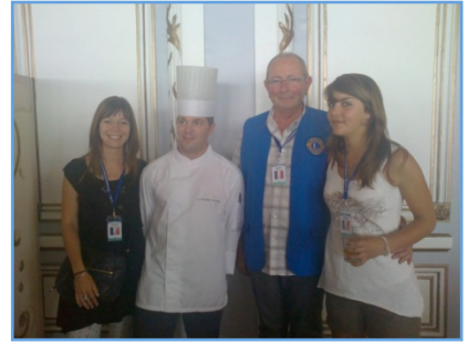
« Avec le Chef du Grand Hôtel de Cabourg »