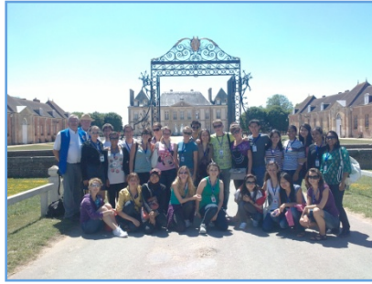
« Le Haras du Pin »