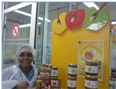
« Le caramel de pommes et la visite de Davigel avec Dieppe Doyen »