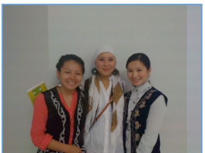
« Exposé du Kirghizstan à St Valéry en Caux »