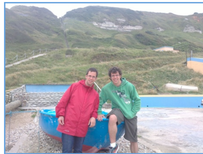
« Les jumeaux à AquaCaux avec la Zone 21 »