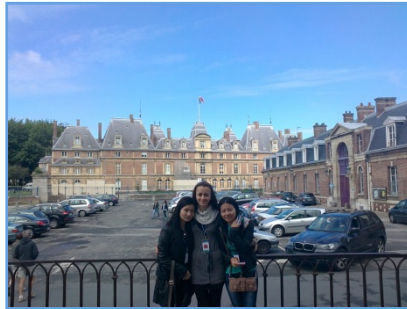
« Le Château d'Eu »