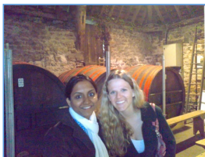
« Ferme cidricole avec le club de Forges »