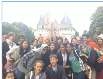
« Au Château de Rambures avec le Club d'Aumale »