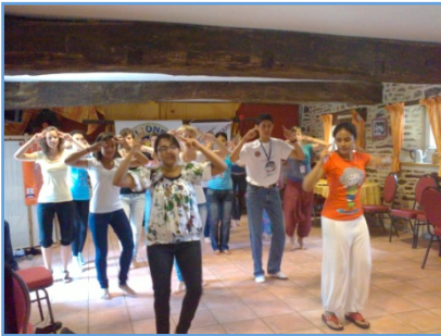
« Répétition de la danse indienne à Flers »